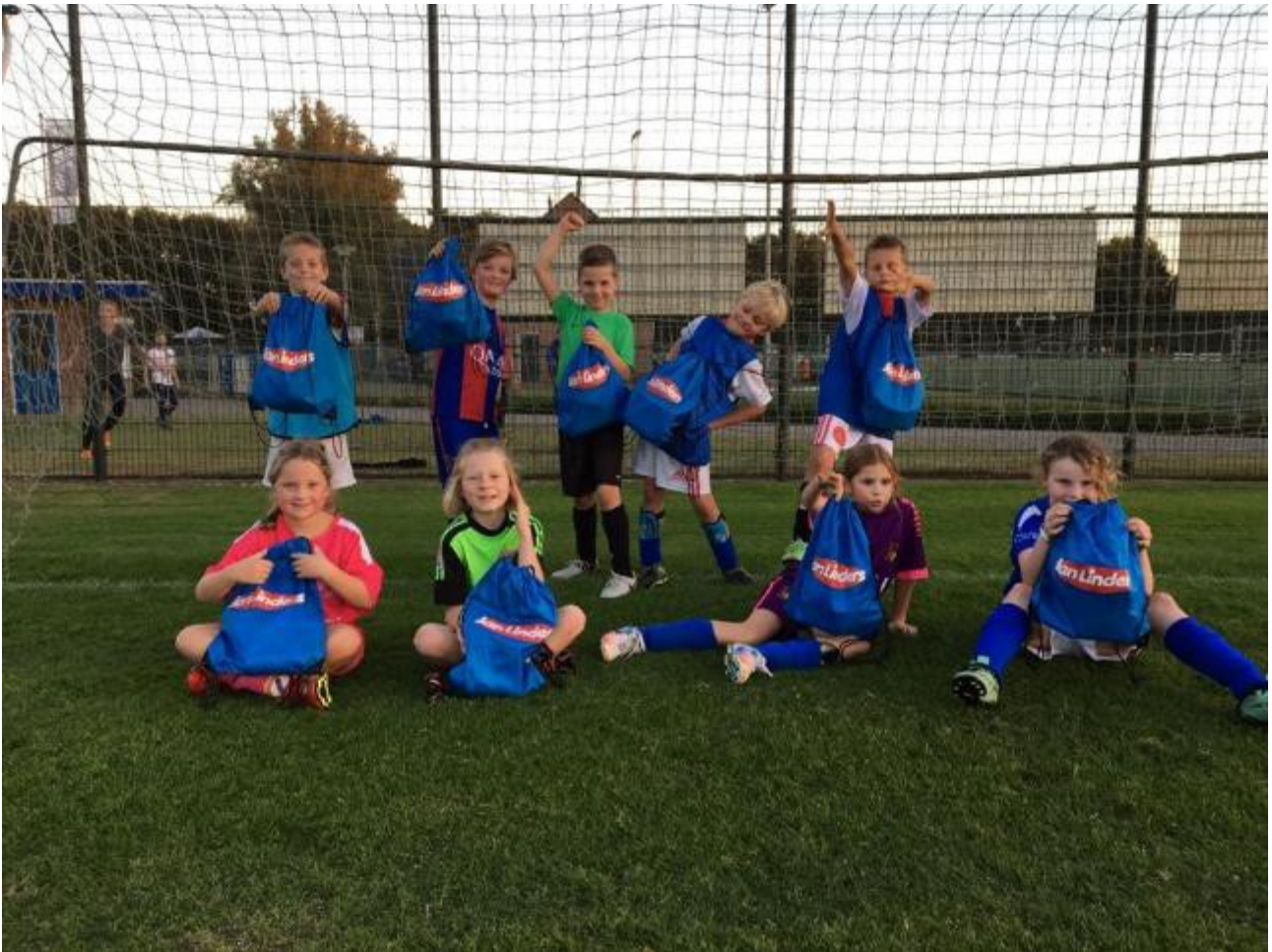
Juliana JO9-3G trots op de gewonnen prijs

https://www.facebook.com/JanLindersMill/?fref=ts