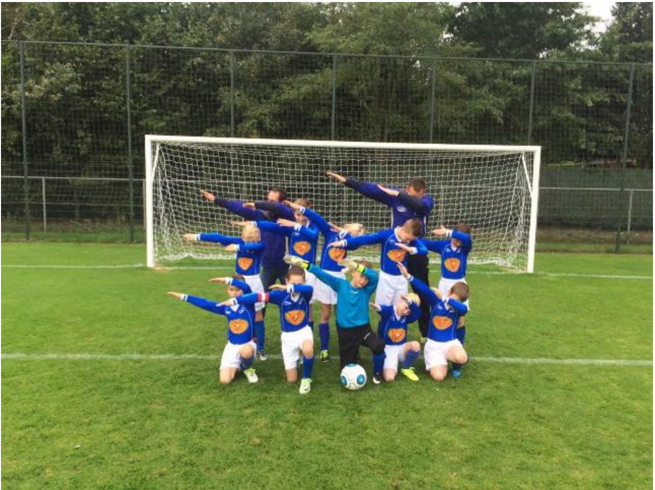
Juliana JO11-3 doet de dep